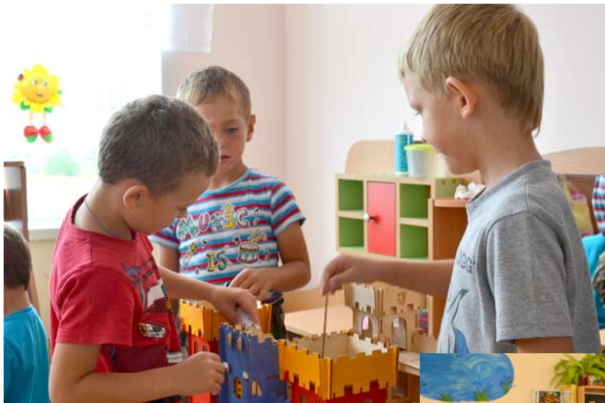
В детском саду всё по высшему разряду.

одной раздевалкой. И таких садов большинство.