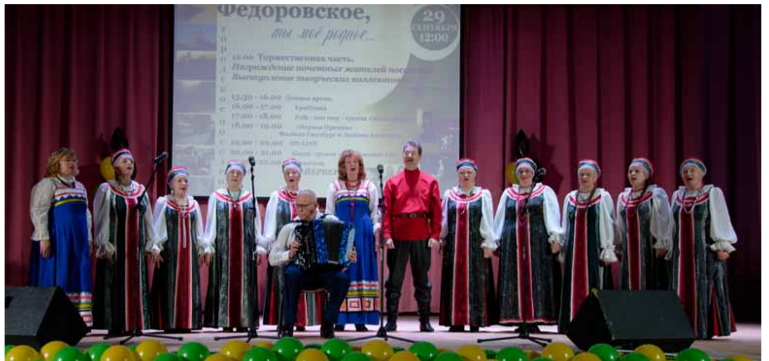
«Зарянка» для Фёдоровского – золотой бренд.