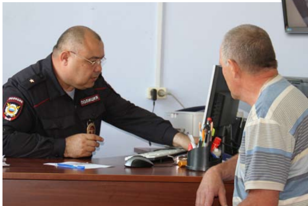
Система видеонаблюдения помогает работе полиции.

Преступления, которые совершаются в нашем поселении, самые разные. Например, жители Глинок с Пионерской улицы уехали из дома. Уже через полчаса дом обокрали. Как выяснилось позже, вор наблюдал за хозяевами и влез в жилище сразу после их отъезда. Не учел только, что в доме осталась дочь хозяев. Девушка услышала шепот и сразу вызвала полицию. Кроме того, на соседнем здании стояли две видеокамеры наблюдения, поэтому вычислили и задержали преступника