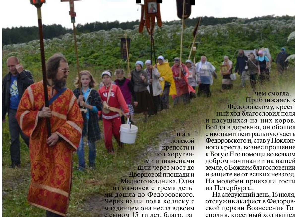
Крестный ход посвящен святой семье последнего русского императора Николая II.

Петрова поста и благословил их в дальний путь.