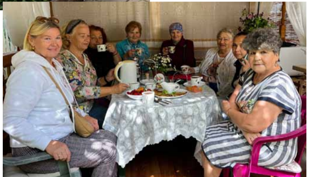
Садоводушки творят настоящую красоту у себя на участках.

Все конкурсанты распределены по номинациям, но границы между ними очень размыты, потому что каждый яв-