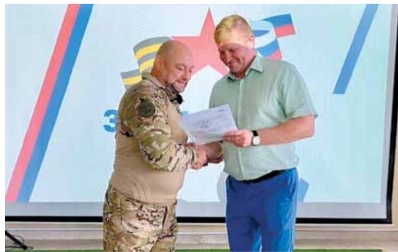
Первый земельный сертификат вручен ветерану СВО во Всеволожске

За оформлением земельного сертификата необходи-