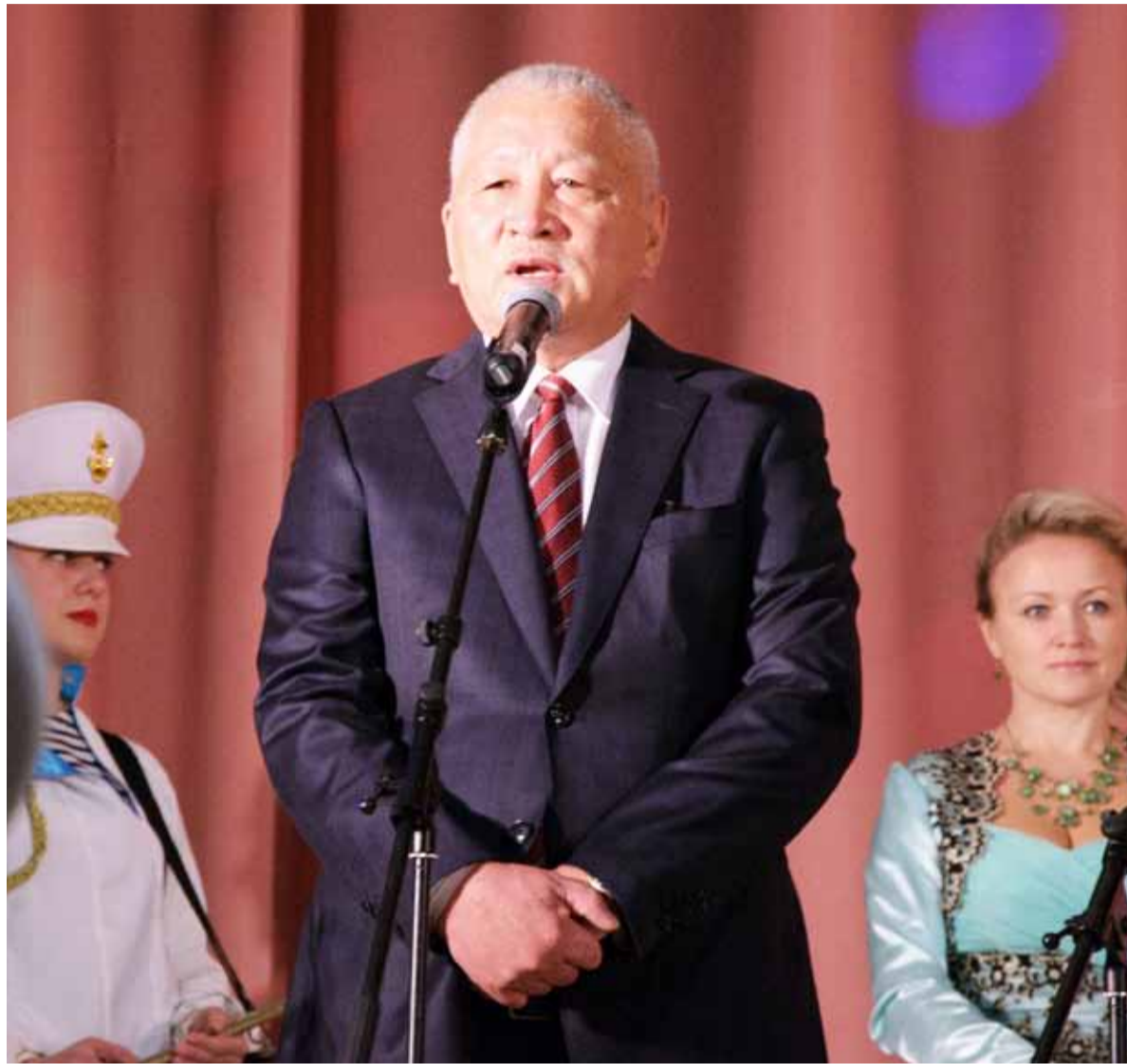
Все 10 лет, работая главой, я не получал зарплату.

— Да, в ней хорошо учили. А после 9-го класса я поступил в Ташкентский техноло-