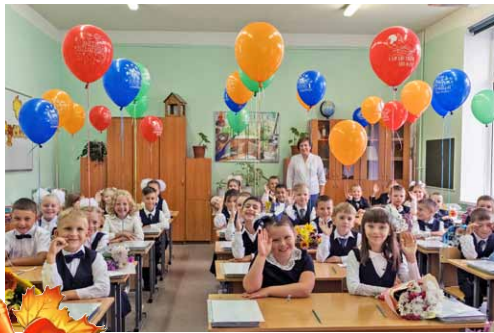
Под добрые напутствия школьники начали учебный марафон.