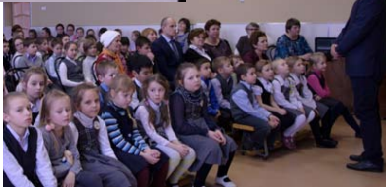
Дети должны знать историю своей страны.

В книге памяти будет 8 разделов: «Бессмертный полк» (фото и краткая информация об участниках «Бессмерт-