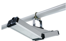
Модуль «Галочка», универсальный (4900р.)

Заменить предлагается на светодиодные лампы типа «Галочка» мощностью 64Вт.