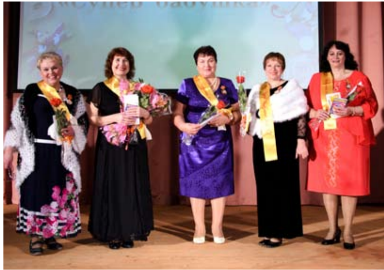
Супербабушки просто супер!

Теперь зрители поняли, что последует дальше. Они с готовностью встретили апло-