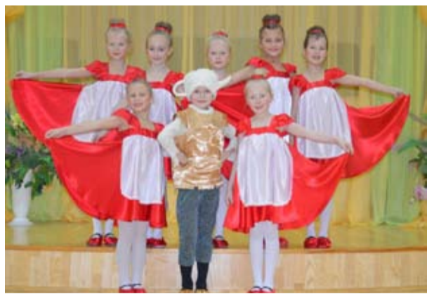
Фестиваль был интересным, а соперники сильными.

тами II степени и получили специальный приз - две бесплатные путевки для солистов «Детей солнца» на конкурс, который пройдет 27-29 марта в Твери.