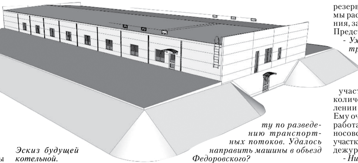
Эскиз будущей котельной.

- Уже запланировано проектирование канализационного очистного коллектора. Новые трубы будут отводить нечистоты из поселения на очистные сооружения. На это средства получены. Также выделяются средства на модернизацию системы водоотведения - сбор сточных вод от многоквартирных домов. Планируемый срок сдачи - конец 2017 года.