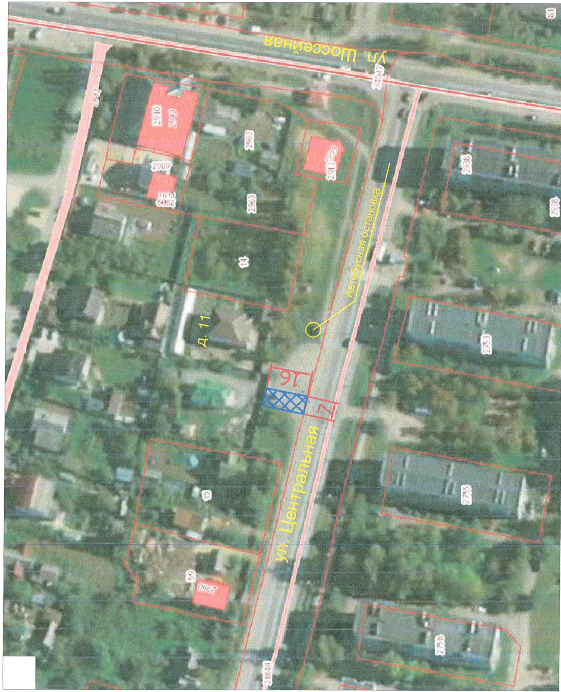
Схема допустимого расположения нестационарных объектов в Федоровском городском поселении Тосненского района Ленинградской области