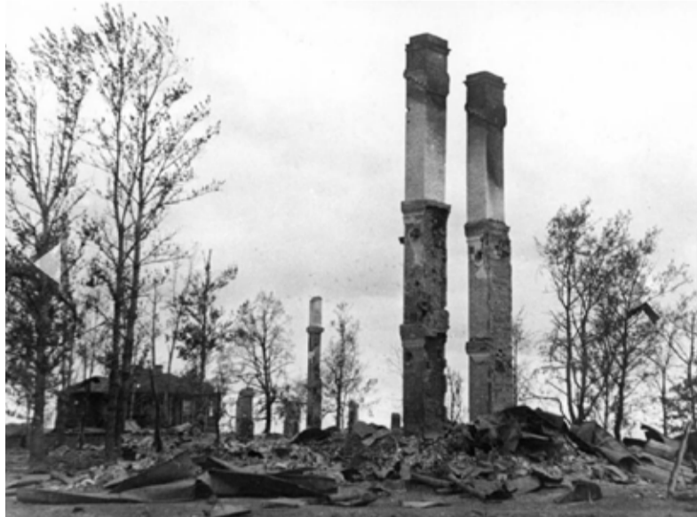
Одна из сожжённых фашистами деревень Ленинградской области.