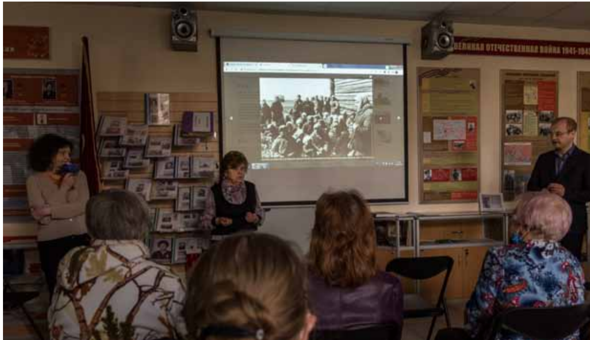
Интерактивные технологии и научный подход позволяют сохранить и рассказать всем о тех поселениях, которые фашисты стёрли с лица земли вместе с жителями.

– Потому что они близки всем нам. Даже тем, кто сейчас живёт в садоводствах на их бывших пепелищах, – продолжает библиотекарь. – У моих родственников есть дача в районе станции Апраксино – это известные места, где шла линия фронта и были уничтожены деревни Вороново, Хандрово и другие. И дачники даже не