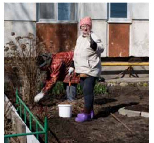
Создадим красоту своими руками!

С другой стороны, субботник – не рядовая уборка, а событие, объединяющее в один коллектив жильцов не-