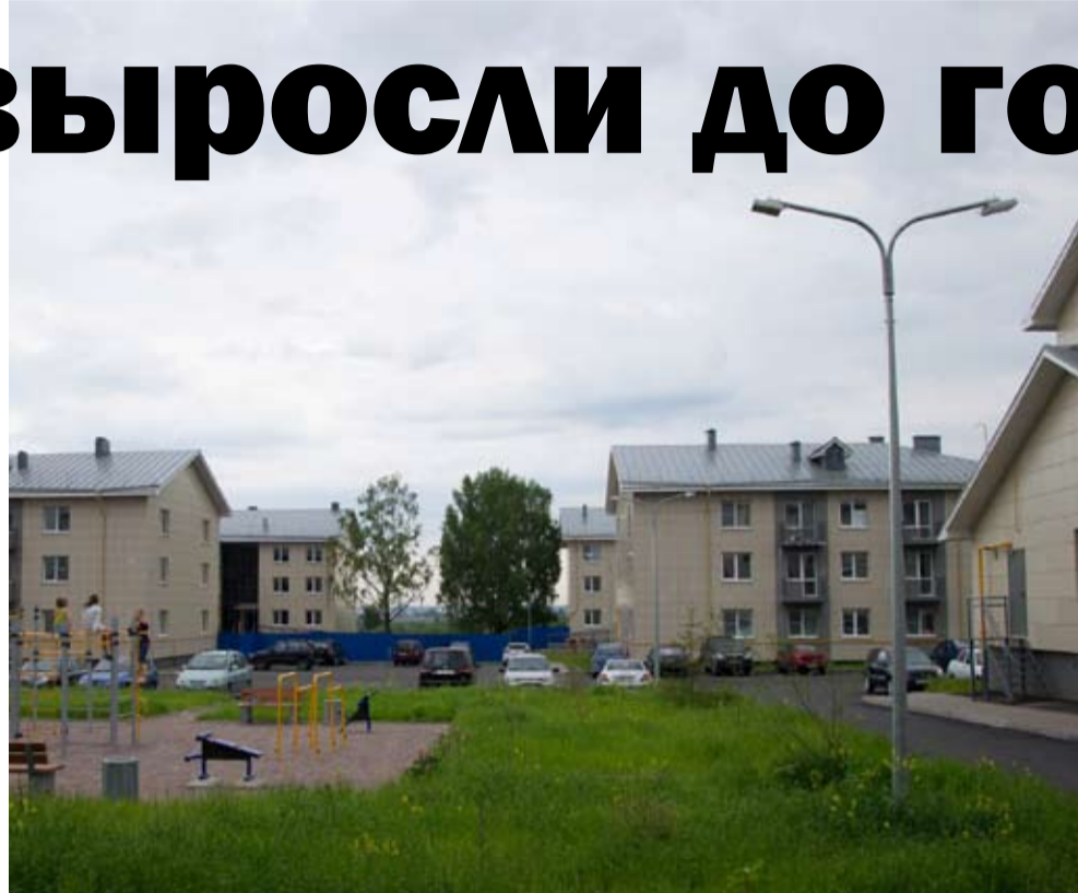
Здания выше 4 этажей строить не будут.

- В настоящее время в Федоровском нет земель сельхозназначения, нет и сельскохозяйственных предприятий. 100% территории переведено либо в земли под строительство жилья, либо в земли промышленного назначения. Бессмысленно оставаться сельским поселением без единого совхоза. Кроме того, в Федоровском постепенно увеличивается количество населения. Это происходит за счет строящегося жилья. В перспективе наш населенный пункт будет развиваться в сторону Ан-