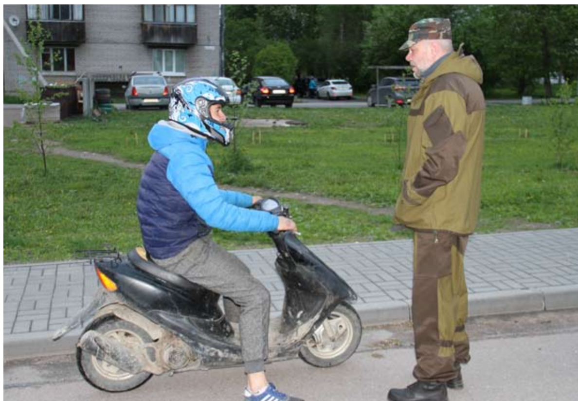
Молодежь надо учить думать не только о себе.

- Чаще всего нам достаточно появиться на горизонте, и хулиганы либо затихают, либо ретируются, - продолжает Вик-