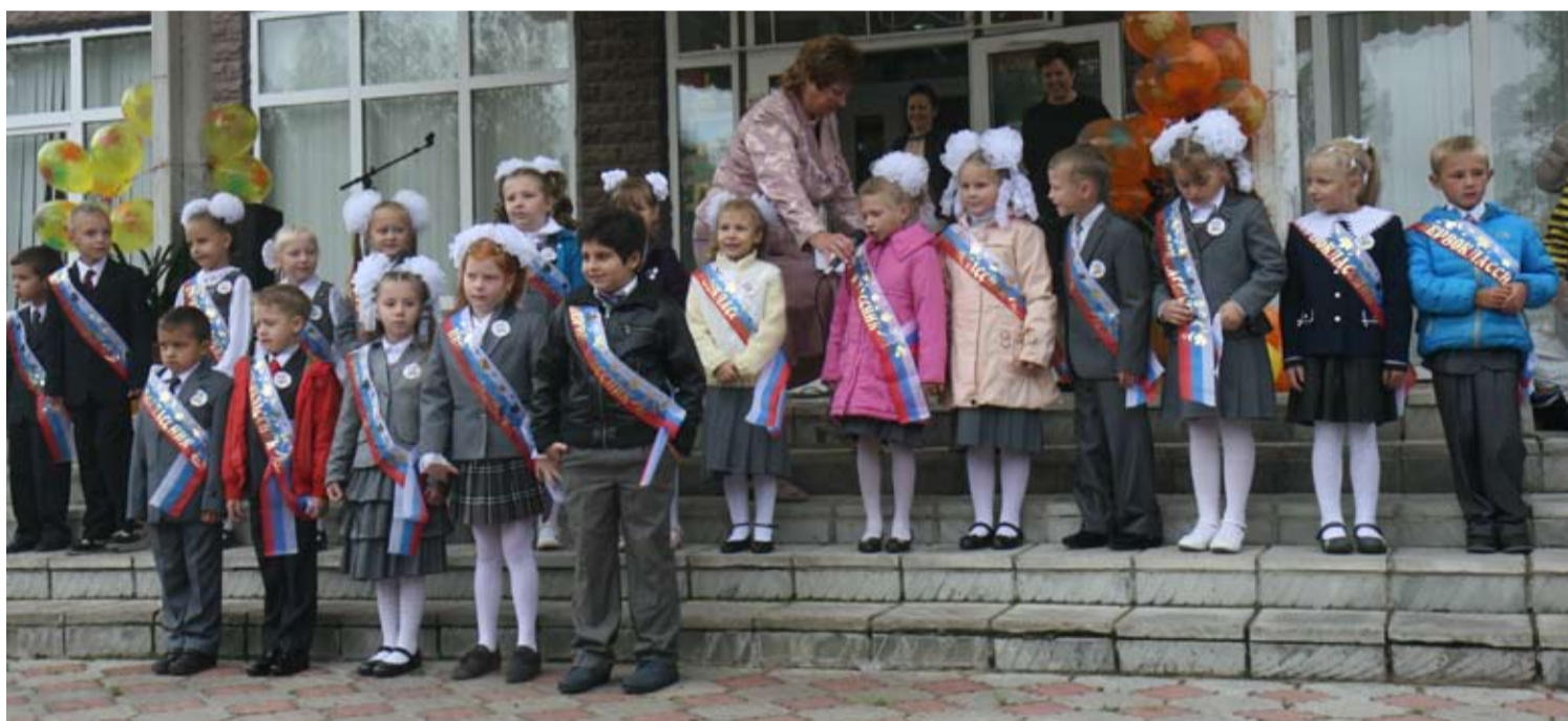
Первоклассники не скрывали волнения.

Праздничная линейка 1 сентября традиционно прошла на площади перед Домом культуры. Дожда, к счастью, не было, поэтому переносить ее не пришлось. Что не могло не радовать федоровцев, привыкших всеми семьями провожать своих детей в Страну знаний.