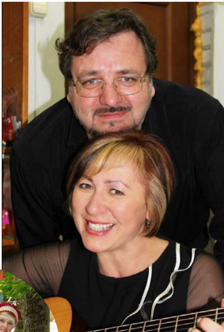
В районе много достойных женщин, и я горжусь, что выбор пал на меня.

Знаете, для каждого из наших сотрудников эта награда стала словно бы личной: настолько они переживали за меня, ждали моего возвращения, настолько были горды мною. Это дорогого стоит. Они меня встретили после награждения в тот же день с улыбка-