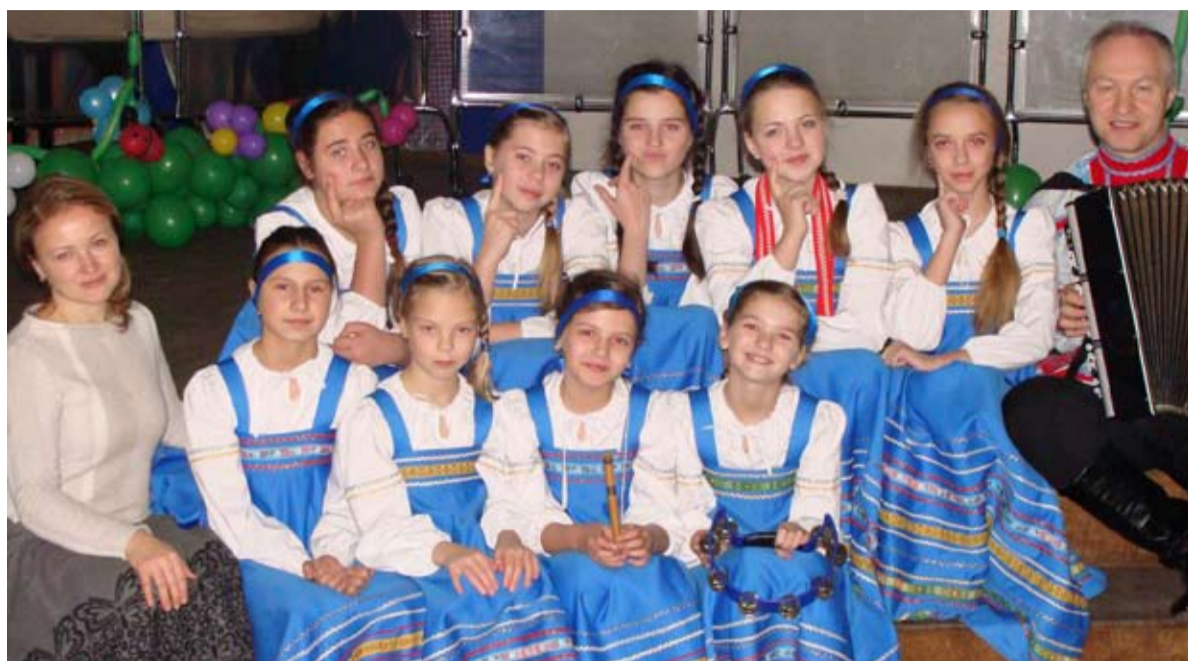
Ансамбль «Настроение» пел народные песни.

- Понятно, что мы не можем тягаться с профессиональ-