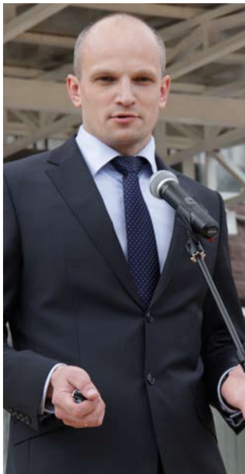
Вместе мы решим все проблемы

Также в течение всего года проводились работы по модернизации освещения в Федоровском, Аннолово и Глинках. Оно улучшено практически на всех детских площадках и парковках. Безусловно, мы продолжим эти работы, существуют места возле жилых домов, где следует установить новые светильники или заменить существующие на более современные. Кстати, благодаря тому, что большинство лампочек на фонарях заменили на энергосберегающие, мы экономим немалые средства.