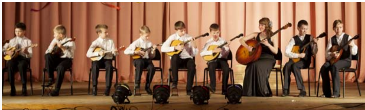
В это день музыканты старались изо всех сил порадовать своих мам.

30 ноября в Доме культуры прошел концерт, посвященный Дню матери.